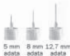
5 mm adata 8 mm adata 12,7 mm adata